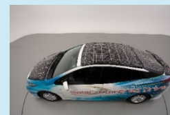
狭い面積でも十分な駆動力が得られる車載用太陽電池モジュール