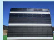
ビル壁面に太陽光パネルを設置した例